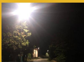
SANTA MARIA ILLUMINAZIONE VIA GAMBADORO