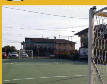
SANTA MARIA CAMPETTO VIA ANDRUCCIOLI