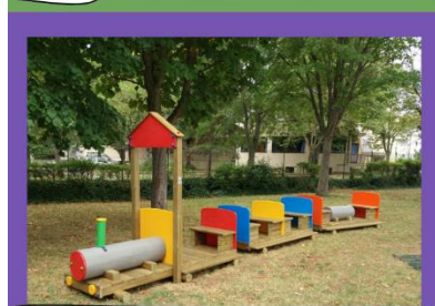
CAPOLUOGO GIOCHI PER NIDO POLLICINO